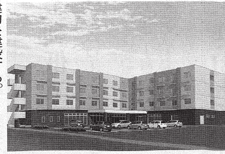
「グランメゾン迎賓館函館 函館湯の川」完成予想図