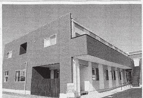
アズパートナーズ、都内練馬区で初のショートステイ事業となる「アズハイムテラス練馬」

有料老人ホーム運営のアズパートナーズはこのほど、東京都練馬区でショートステイ事業を始めた。デイサービスセンターや居宅介護事業所を併設する。同社がショートステイ事業を行うのは今回が初めて。