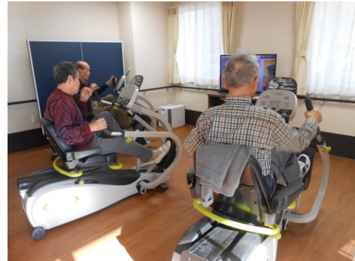
マシーントレーニング