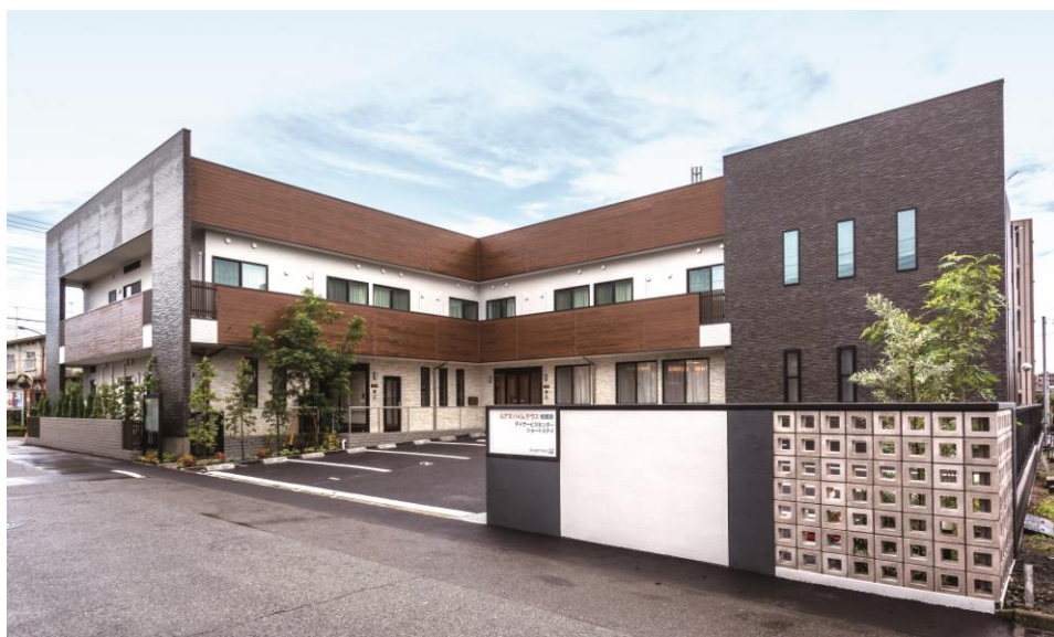
アズハイムテラス相模原 外観

より多くの方々にアズハイムを知っていただき、お客様の希望に応えられるショートステイ・デイサービスセンターを目指して、利用者様へ対する充実のサービス提供に邁進して参ります。