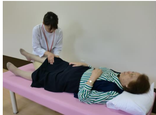
リハビリ専門職の個別指導