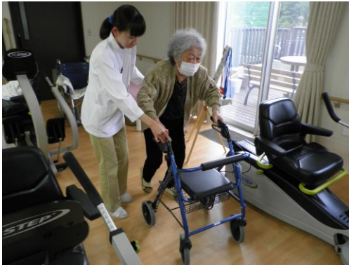
理学療法士による個別訓練の実施

リハビリ専門職である理学療法士等が、その方に合わせた個別プログラムを作成し、目標や楽しみをもって機能訓練に取り組めるよう支援してまいります。マシーントレーニングやエアロビ体操、マット体操など運動プログラムの充実を図っております。