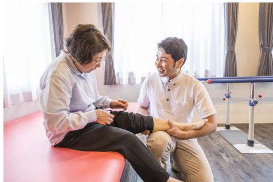
理学療法士による個別訓練・リハビリの実施