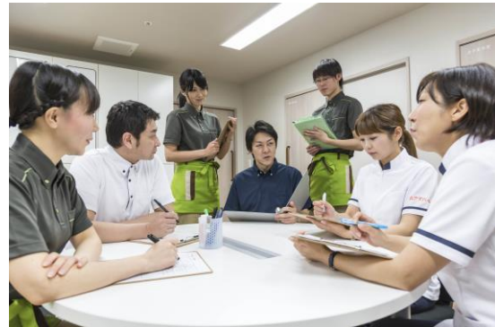
個別のニーズに柔軟に対応するスタッフ体制を構築