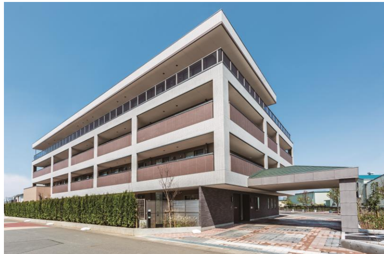
アズハイム三郷 建物外観