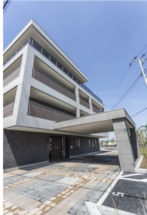
エントランスエリア