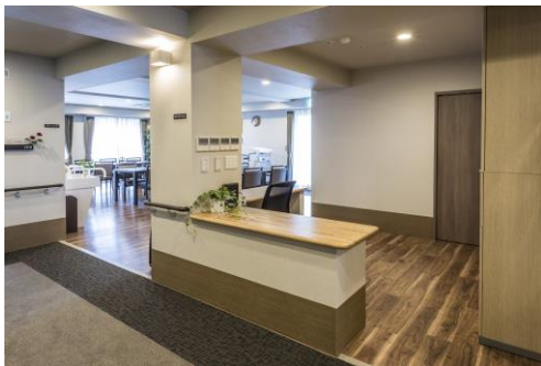
見守り重視のヘルパーステーション

各居室には大型の収納やカウンターを設置してお客様の用途に合わせて利用できるようにしています。また、頻繁に利用する手洗いはあえてトイレルームの外へ設置。利用勝手を重視しながらもキャビネットなどを設け住空間の設えに影響のないよう考慮しました。