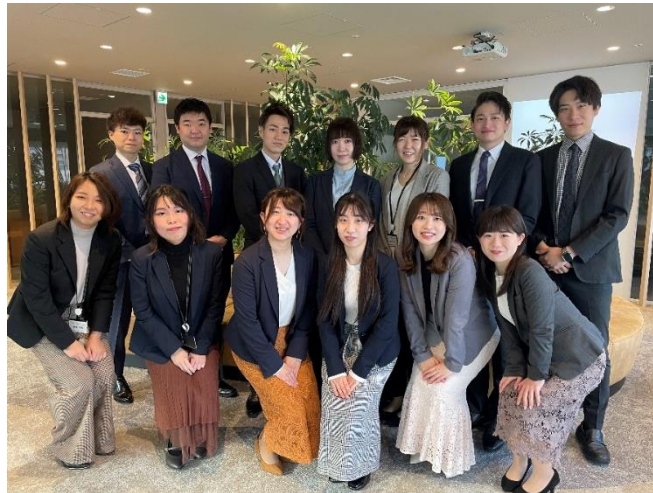
アズパートナーズ 新卒採用セクション メンバー

最近の学生の傾向としても、プライベート重視、個人として尊重されたいという傾向が高く、一人ひとりにじっくりと向き合うリクルーター制度は、より一層重要性を増していくと考えています。