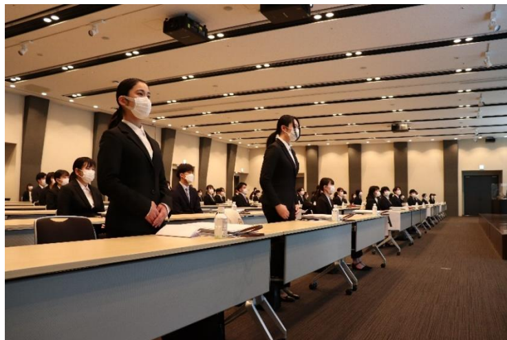
2022年度入社式の様子 (2022年4月1日)